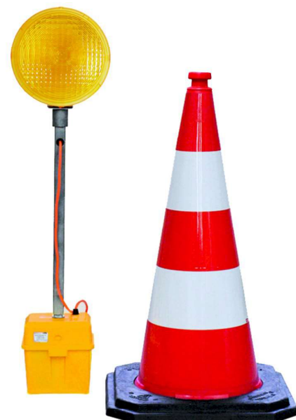
Passend für Leitkegel 750 mm