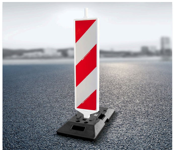
Standard-Leitbake in Fußplatte K1