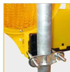
BakoLight mit Masthalter