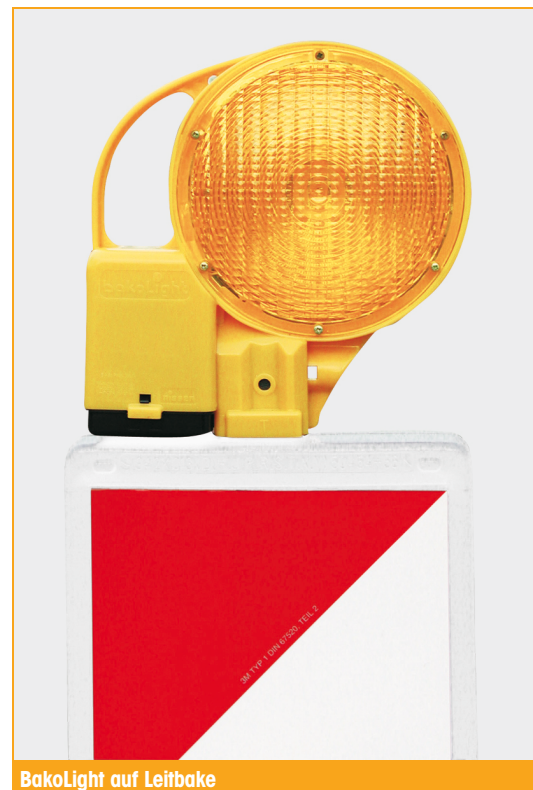
BakoLight auf Leitbake

12 Leuchten in einem Karton / 216 Leuchten auf einer Palette auch in anderen Stückzahlen lieferbar