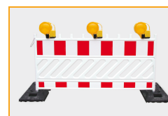
BakoLight auf Absturzsicherung